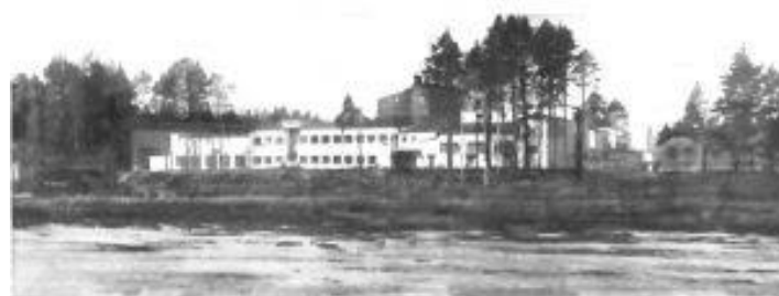
Дворец Культуры на берегу Щучьего озера

В озере в старые времена рыбы было в избытке. Из печатных изданий мы знаем, что в дореволюционный период, на озера из окрестных деревень, приезжали мужики ловить рыбу. Рыбы было столько, что ее возами отправляли на ярмарку.