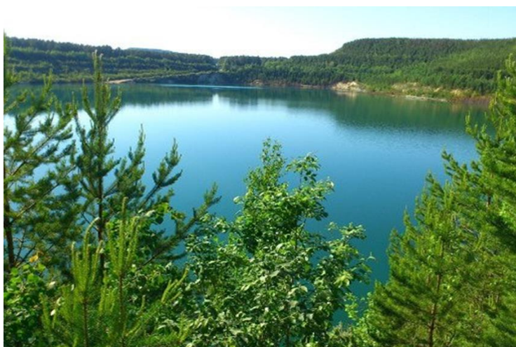
карьер «Липовый лог»

Карьер был отработан в 1992 году, т.е. всего за 6 лет. К моменту отработки глубина карьера достигала более 100 метров, при его размерах 750×450 метров. Сейчас карьер место отдыха жителей города Асбеста.