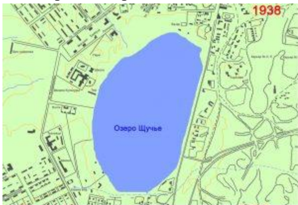
Озеро Щучье на плане города - 1938 г.

Старожилы рассказывали, что еще в конце пятидесятых годов, из окон