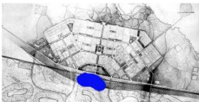
Генеральная схема планировки г. Асбеста. Свердловпроект -1938 г.

Озеро было главной достопримечательностью города. По плану застройки города 1938 года предполагались улицы, веером расходящиеся от озера.