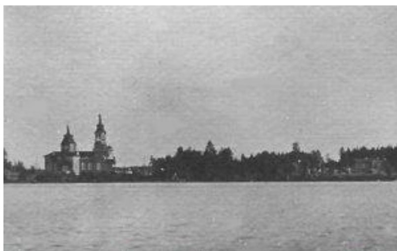
Церковь на берегу Щучьего озера - 1929 г.