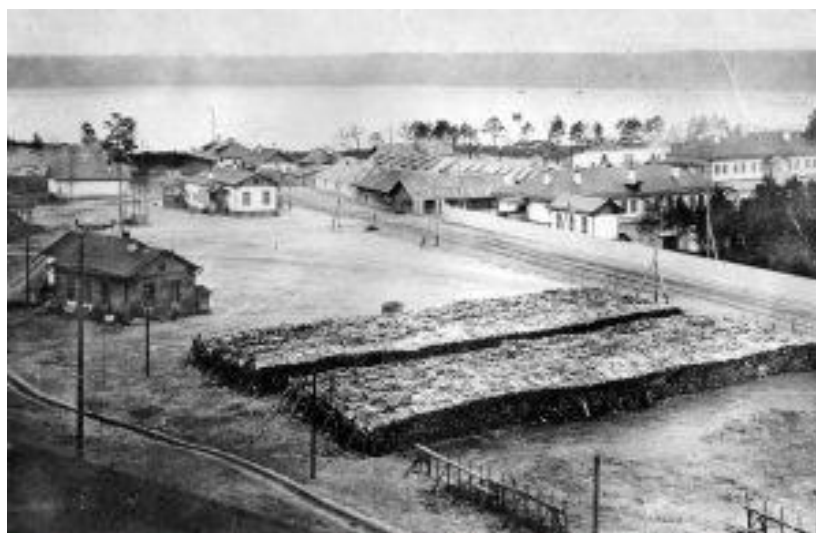
Посёлок Поклевского-Козелл на берегу Щучьего озера.